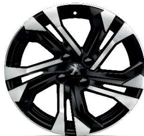
SALAMANCA 17" Allure Pack