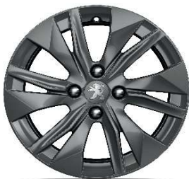
ELBORN 16" Active Pack