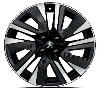
BUND 18" GT