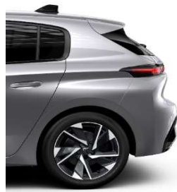
Allure Pack 17' Alloy Halong